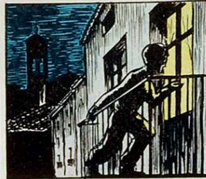
Saben que pels balcons els veuen uns patges, si de debò creuen.