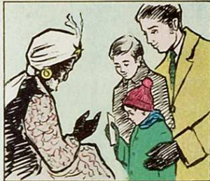
La carta entreguen molt satisfets, esperant veure's plens de juguets.