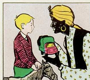
Cavalls, camions, molta tropa, pel bon nen que's menja la sopa.