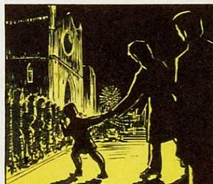
L'altre petit, molt impacient a la mare agafa amatent.