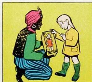
Entreguen la nina i el cotxet a la que estima al germanet.