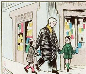
La mainada la carta compren fa casa amb esperança l'omplen.