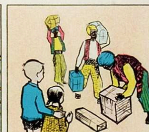
Els qui als pares no fan enfadar coses tenen per donar.