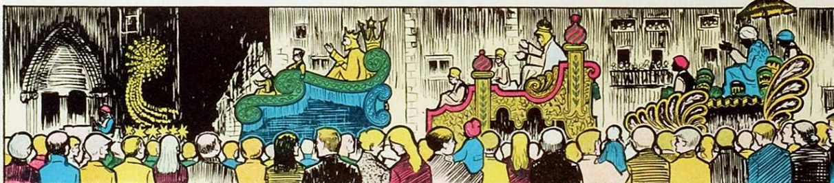
Passa, gallarda, refulgent, la brillant estrella d'Orient.