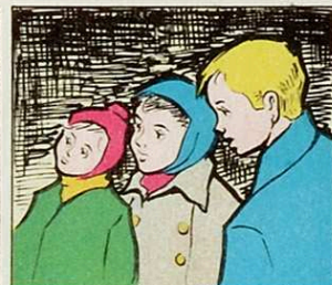
Alguns, amb sorpresa i temó mostren els ulls amb expectació.