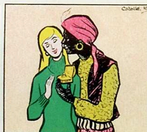
I a la donzella que és promesa reb obsequis com de princesa.