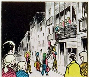
Lleugers s'enfilen pels balcons patges que porten il·lusions.