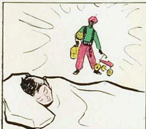
I els xics somnien contínuament dies d'anhel, dolçor, però rient...