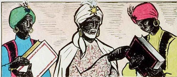
Un llibre blanc els ha ensenyat, on els nens bons s'hi ha anotat.