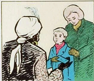
Voldria jo, llibres i un camió, però... posar portin carbó?