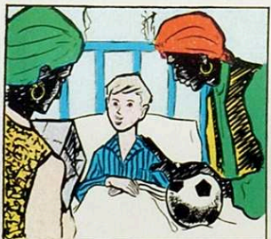
Visiten nens que estan malats omplint-los el lli de regals.