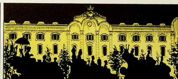
Quan han donat el necessari, i la nit quasi és acabada: