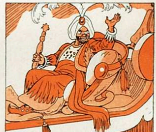
oferint-li rics presents de mirra, or i encens.