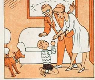
I si tu no has sigut bo, fes l'acte de contrició.