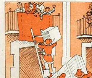
Posen l'escala, i el patge s'hi enfila amb gran coratge.