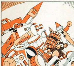
Des de bitlles i timbals fins a coets «espacials».