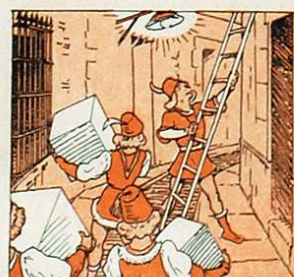
I d'incògnit la ciutat omplirà llur Magestat.