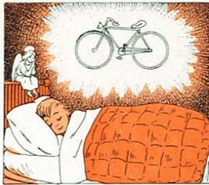
perquè allò que demaneu us ho duren, no en dubteu!