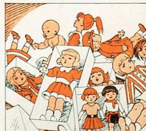
i nines de totes menes per fer contentes les neues.