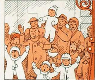
salutant als Grans Senyors amb cor net i generós.