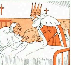
Van primer a l'Hospital, no es descuiden ni un malalt.