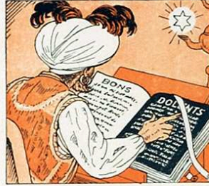
Prò en Faruk ja sap de sobres quines són les vostres obres.