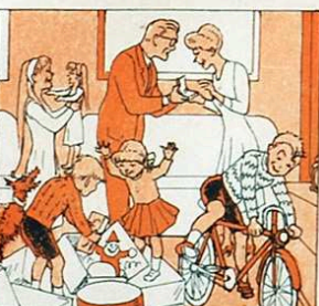
satisfent les il·lusions tant de grans com d'infants.