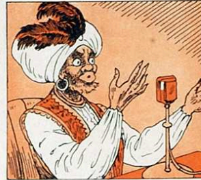
I diàriament el patge us envia el seu missatge: