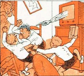
que als infants que són dolents no els hi porten poc ni gens.