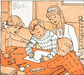
Una «carta» els hi escriureu i al «Nacional» la dureu.