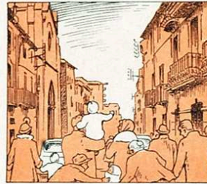
Amb el nas molt ben tapat aneu a la Soledat.