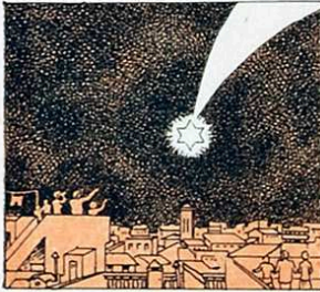
Ja brilla en el firmament l'estel dels tres Reis d'Orient.