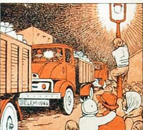
¡Quants camions, i van ben plens de juguets per tots els nens!