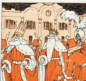
Ja són a Sant Agustí, ja han acabat llur camí.