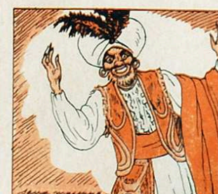
I ara, infants, adéusiau, fins l'any que ve, si a Déu plau.