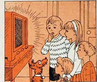
Que heu de creure i estudiar, menjant de tot, sens plorar.