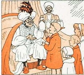
El patge us esperarà i obsequis repartirà.