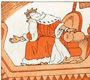
A Jesús han adorat i llurs fronts han humiliat...